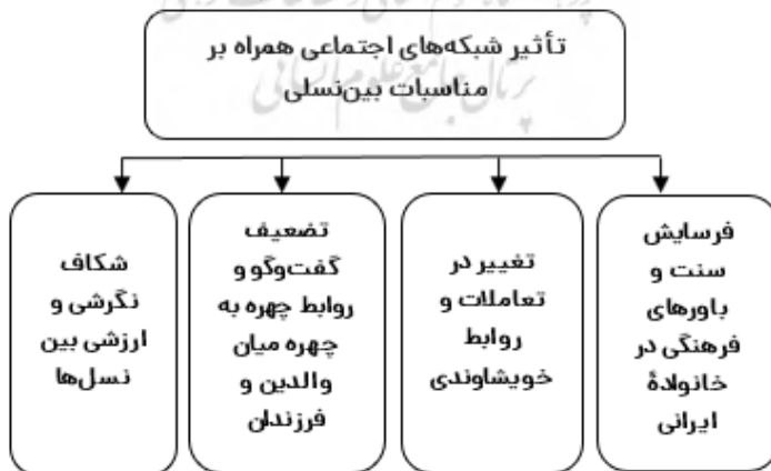
شکل ۲. نمودار یافته‌های عینی پژوهش

همراه هستند و کمتر در تفریحات خانوادگی شرکت می‌کنند و این نیز می‌تواند یکی از پیامدهای منفی جامعه‌ی شبکه‌ای باشد؛ به‌طوریکه فرد در کنار والدین و اعضای خانواده قرار گرفته و به‌طور مکرر، به استفاده از امکانات این شبکه‌ها می‌پردازد؛ چه بسا این استفاده، به‌مرور، تبدیل به عادت شده و افراد به‌جای پرداختن به تفریحات خانوادگی، تماشای دسته‌جمعی فیلم و سریال‌های تلویزیونی، رفتن به مکان‌های گردش‌ی به‌صورت دسته‌جمعی، انجام بازی‌های خانوادگی و ... مدت‌زمان زیادی را در فضای مجازی سپری کرده و کوتاه‌ترین مکالمات و ارتباطات فیزیکی و کلامی را با یکدیگر برقرار کنند. باید توجه داشت که شبکه‌های اجتماعی همراه- با توجه به کارکردهای متنوع و ویژگی‌های جدید و جذاب- در زندگی افراد، به‌ویژه جوانان، نقش مهم و غیرقابل انکاری را ایفا می‌کنند. این شبکه‌ها به درون روابط و تعاملات خانوادگی راه یافته و توانستند برخی از مناسبات بین‌نسلی میان نسل پیشین (والدین) و نسل امروز (فرزندان) را دچار دگردیسی کنند. رسانه‌های اجتماعی، از جمله شبکه‌های اجتماعی همراه، روند نوسازی در عرصه‌ی روابط خانوادگی و مناسبات بین نسل‌ها را تسریع و در جهت تضعیف پیوندهای سنتی در خانواده، عمل می‌کنند. با تقویت پیوندهای عاطفی میان والدین و فرزندان و نزدیکی نگرش والدین به عقاید جوانان و گسترش فرهنگ استفاده‌ی بهتر از شبکه‌های اجتماعی همراه، به‌گونه‌ای که این ابزارها در خدمت انسان باشد، نه شکل‌دهنده‌ی رفتار او، می‌توان از بسیاری از عواقب جبران‌ناپذیر در بنیان خانواده، جلوگیری کرد. در پایان، یافته‌های عینی پژوهش را می‌توان در قالب نمودار زیر ارائه کرد: