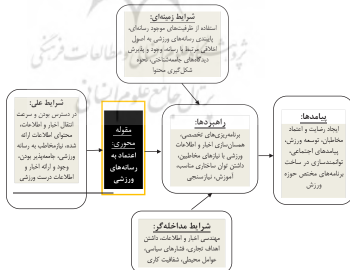
Figure 1. The final model of audience trust in a variety of sports media