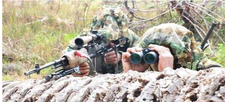
شکل (۴): نمایش سازمان دونفره تیم تک تیراندازی

به عنوان مثال از تک تیراندازان معروف داعشی می توان به "نورا"، دختر روس، به عنوان یکی از خطرناک ترین تک تیراندازان گروه تروریستی داعش در فلوجه اشاره کرد که از مهم ترین عناصری است که به محض ورود نیروهای عراقی به این شهر، تحت تعقیب قرار گرفت (العالم، ۳۰ خرداد ۱۳۹۵).