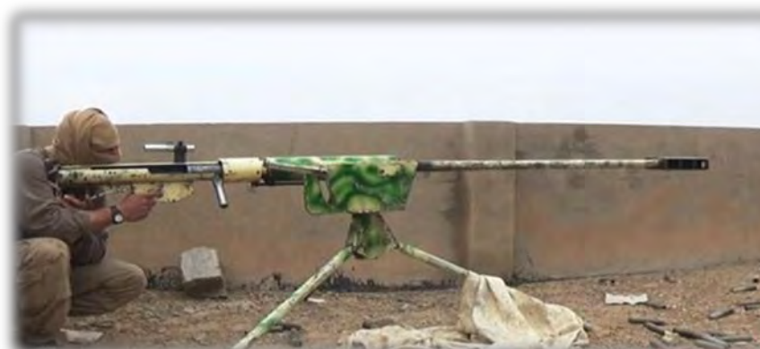
شکل (۵): یک نوع سلاح تک‌تیرانداز دشمن

۱- ضرورت و اهمیت عملیات محافظت و مصون ماندن از آسیب و خطر تک‌تیراندازان دشمن. رکن اساسی عملیات ضد تک‌تیراندازی، عملیات محافظت و مصون ماندن از آسیب و خطر تک‌تیرانداز می‌باشد و این عملیات، چگونگی در امان ماندن از اصابت تیر و شلیک تک‌تیرانداز را بیان می‌نماید. لازمه مقابله با تک‌تیراندازان داعشی مصون ماندن از آنهاست؛ چرا که اگر در منطقه و عملیات سالم نمانیم؛ دیگر هیچ عملیاتی نمی‌توانیم انجام دهیم؛ بنابراین ضروری‌ترین بخش عملیات ضد تک‌تیراندازی، عملیات محافظت و مصون ماندن از تیراندازی و تک‌تیراندازان دشمن می‌باشد. مصون یا در امان ماندن یعنی اینکه اولاً چه کار کنیم که در معرض دید و تیر تک‌تیرانداز قرار نگیریم؟ مورد اصابت واقع نشویم. ثانیاً اگر خود یا سایر هم‌زمانمان مورد اصابت قرار گرفتیم، چگونه از مهلکه و خطر تک‌تیرانداز دشمن فرار نموده و خود را از مرگ برهانیم، یا آثار شلیک یا اصابت را کاهش دهیم.