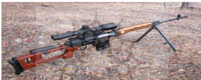
شکل (۲): سلاح تک تیرانداز دراگونوف

جعبه گردنده تیر دارد. با خشاب تغذیه می شود. این اسلحه مجهز به مگسک های فلزی است و دوربین تلسکوپی ۱- PSO با قدرت ۴ برابر است که با باطری کار می کند. همچنین این اسلحه متاسکوپی دارد که می تواند منبع اشعه مادون قرمز را ردیابی کند. این اسلحه را نیروهای مسلح سابق عضو پیمان ورشو استفاده می کنند. حفره ای دارد که انگشت شست در آن قرار می گیرد و دستگیره پیستولی دارد. همراه با تلسکوپ و ۱۰ خشاب گردنده، وزنی در حدود ۹/۶۴ پوند دارد. طول آن ۱۲۲/۵ cm است و طول لوله اش ۶۲ cm است. سرعت شلیک از دهانه آن در هر ثانیه ۲/۷۲۲ فوت است و حداکثر برد مؤثر آن ۸۰۰ متر است (بی نا، ۱۳۸۵: ۱۰).