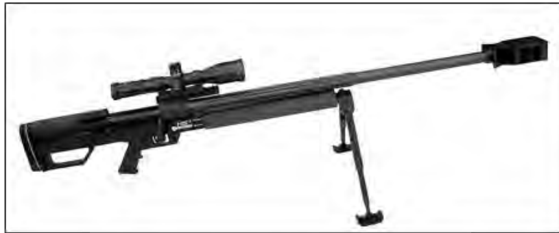
شکل (۱): سلاح تک تیرانداز اشتایر

و دارای یک نوع دستگاه نشانه روی تلسکوپی (دوربین) می باشد. این سلاح دارای یک دوپایه ای استاندارد نیز می باشد (زمانی و همکاران، ۱۳۸۵: ۴).