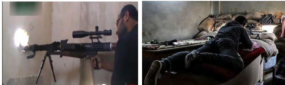
شکل (۳): نمایش سازمان تک‌نفره تک‌تیراندازی

به عنوان مثال در درگیری‌های حاضر با گروه داعش، اکثر سازمان تک‌تیراندازان یک نفر می‌باشد که در آن واحد منطقه را دیدبانی می‌کند و مسافت خود تا هدف را تخمین می‌زند و هم‌زمان بر روی هدف نشانه‌روی می‌کند و به سمت آن شلیک می‌نماید. البته در سازمان تک‌تیرانداز نیروهای سوری نیز در این نبرد یک نفر مشخص شده است. در برخی دیگر از سازمان‌ها و ارتش‌ها، تیم‌های تک‌تیراندازی‌شان شامل دو نفر یعنی یکی دیده‌بان و دیگری تک‌تیرانداز می‌باشد. حالت سوم، تیم تک‌تیراندازی از دو دیده‌بان در طرفین؛ یکی راست و دیگری سمت چپ منطقه را به صورت هم‌زمان و به صورت تخصصی‌تر، منطقه را به صورت شطرنجی و وجب‌به‌وجب مورد دیدبانی قرار می‌دهند و تک‌تیرانداز نیز در وسط منطقه، هدف‌های کشف و پیدا شده را، مورد اصابت قرار می‌دهد؛ بنابراین تک‌تیراندازان یا تقویت‌کننده نیروها، فرد یا تیم کوچکی هستند که با استفاده از تاکتیک‌های ویژه، می‌توانند همان تلفات زیادی را به دشمن وارد نمایند که یک نیروی بزرگ قادر به انجام آن است. از این رو به ایشان لقب ارتش دونفره را نیز داده‌اند (کشتندار و همکاران، ۱۳۹۴: ۳۹).