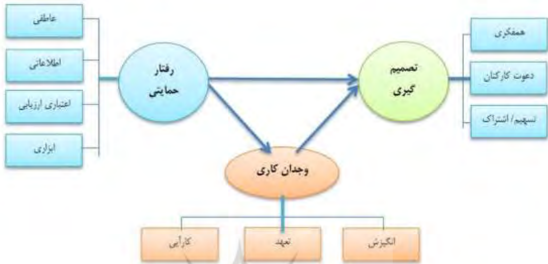
شکل یک: مدل مفهومی تحقیق