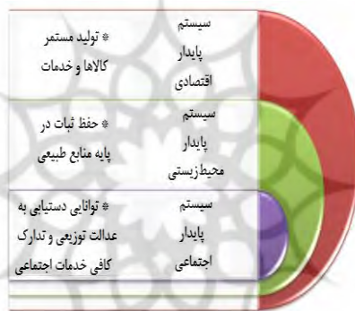
شکل ۱: سیستم پایدار

مفهوم اصل پایداری بین متخصصان مختلف، زمانی که آنها پایداری را تعریف می‌کنند، متفاوت است. محققان محیط‌زیست، پایداری را با تمرکز اصلی بر محیط‌زیست تعریف می‌کنند و اقتصاددانان، تمرکز خود را به بخش اقتصادی و غیره انتقال می‌دهند. با این حال، هر سیستم سه بُعد اقتصادی، اجتماعی و زیست‌محیطی دارد و تمام این سه مورد باید در توسعه پایدار مد نظر قرار گیرد. شکل ۱ انعکاس یک سیستم پایدار است که تمام این سه ستون، مفهوم اصلی پایداری را شکل می‌دهند و شکل ۲ ارتباط بین ابعاد پایداری را نشان می‌دهد که مبتنی بر قرارگیری سه بُعد تشکیل‌دهنده متحدالمرکز در درون یکدیگر است (طالب‌پور و داوری، ۱۳۹۸: ۲۷).