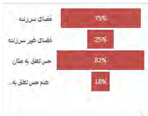
تصویر ۳: نظر کاربران درباره سرزندگی و حس تعلق فضای بلوار طاقبستان

در جدول ۳ رابطه معنا داری میان سرزندگی در فضای شهری و متغیرهای پژوهش بیان شده است. بر طبق تحلیل ها سرزندگی با مدت استفاده فرد از فضا رابطه معنا دار و معکوس دارد. هرچه فرد دفعات کمتر از این خیابان استفاده کرده باشد حس سرزندگی بیشتری