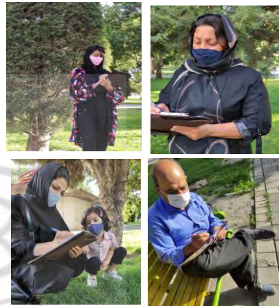
تصویر ۱: تعدادی از افراد تکمیل کنندگان پرسش نامه

استفاده کننده از این بلوار نامشخص می‌باشد از فرمول کوکران برای محاسبه حجم نمونه جامعه آماری نامحدود استفاده شد. در این رابطه با سطح اطمینان ۹۵ درصد تعداد افراد نمونه ۳۸۴ نفر محاسبه شد. در جهت تحقق این هدف و کاهش خطا ۴۰۰ پرسشنامه توسط عابرن تکمیل گردید. از این تعداد پرسشنامه ۳۸۱ عدد از آنها درست تکمیل شده و قابل استناد می‌باشند، تصویر ۱ تعدادی از پرسش شونده‌گان در حال تکمیل پرسشنامه را نشان می‌دهد.