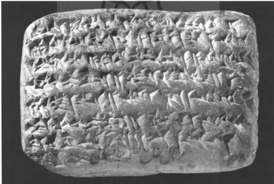
شکل ۱: روی گِل‌نوشته

اصلی آن مشخص نشده است. ظاهراً، بیل-ایدین مُرده بود و همسرش با پرداختِ بدهی‌هایی، که او در طول زندگی به بار آورده، روبه‌رو بود. سند هیچ اشاره‌ای به مبلغ اضافی نقره برای بازپرداخت در آینده نکرده است؛ بنابراین به نظر می‌رسد که اکنون تمام بدهی تسویه شده است. رسید پرداخت در دو نسخه صادر شده است؛ یکی برای بدهکار (پیشین) به عنوان مدرک پرداخت و دیگری برای بستانکار (پیشین) برای کارهای محاسباتی [تجارت‌خانه]. هیچ شکی نیست که این گِل‌نوشته متعلق به طلبکار است، چراکه از بایگانی او (وام‌دهنده) است که [تا کنون] هزاران گِل‌نوشته به دست ما رسیده، در حالی که هیچ لوحی از [جانِب] وام‌گیرنده باقی نمانده است.