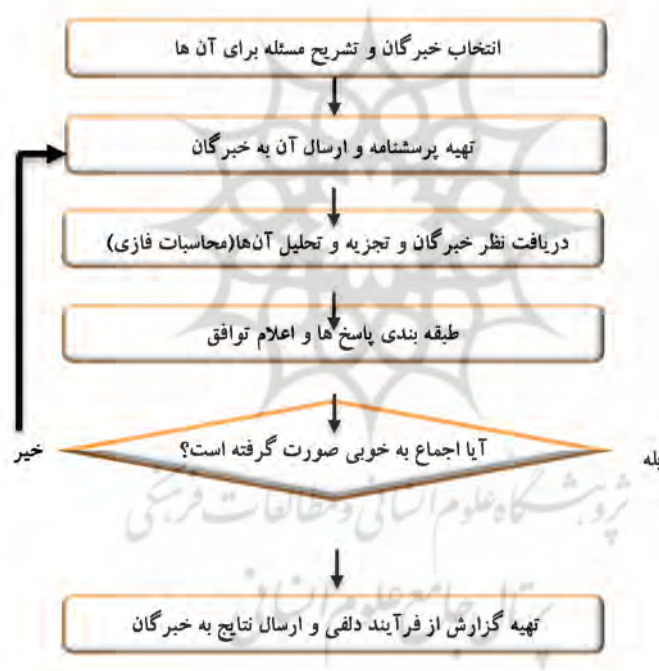
شکل ۳. الگوریتم دلفای فازی