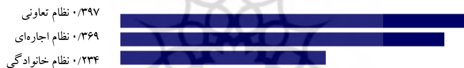
شکل ۵. نمودار گرافیکی گزینه‌های مورد مطالعه از نظر معیار سرمایه اجتماعی

نتایج حاصل از مقایسه سرمایه انسانی در سه نظام بهره‌برداری خانوادگی، اجاره‌ای و تعاونی در جدول ۷ و شکل ۶ نشان می‌دهد نظام بهره‌برداری تعاونی (با امتیاز ۰/۳۴۳) بالاترین اولویت را به خود اختصاص داده است و سرمایه انسانی در نظام بهره‌برداری خانوادگی (با امتیاز ۰/۳۲۹) در اولویت دوم و سرمایه انسانی در نظام بهره‌برداری اجاره‌ای (با امتیاز ۰/۳۲۸) در اولویت سوم جای دارند.