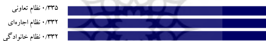
شکل ۲. نمودار گرافیکی گزینه‌های مورد مطالعه از نظر معیار سرمایه فیزیکی

نتایج حاصل از مقایسه سرمایه طبیعی در سه نظام بهره‌برداری خانوادگی، اجاره‌ای و تعاونی در جدول ۴ و شکل ۳ نشان می‌دهد که نظام بهره‌برداری تعاونی (با امتیاز ۰/۳۶۶) از لحاظ سرمایه طبیعی بالاترین اولویت را دارد. همچنین نظام بهره‌برداری اجاره‌ای (با امتیاز ۰/۳۲۹) در اولویت دوم و نظام بهره‌برداری خانوادگی (با امتیاز ۰/۳۰۶) در اولویت سوم جای دارد.