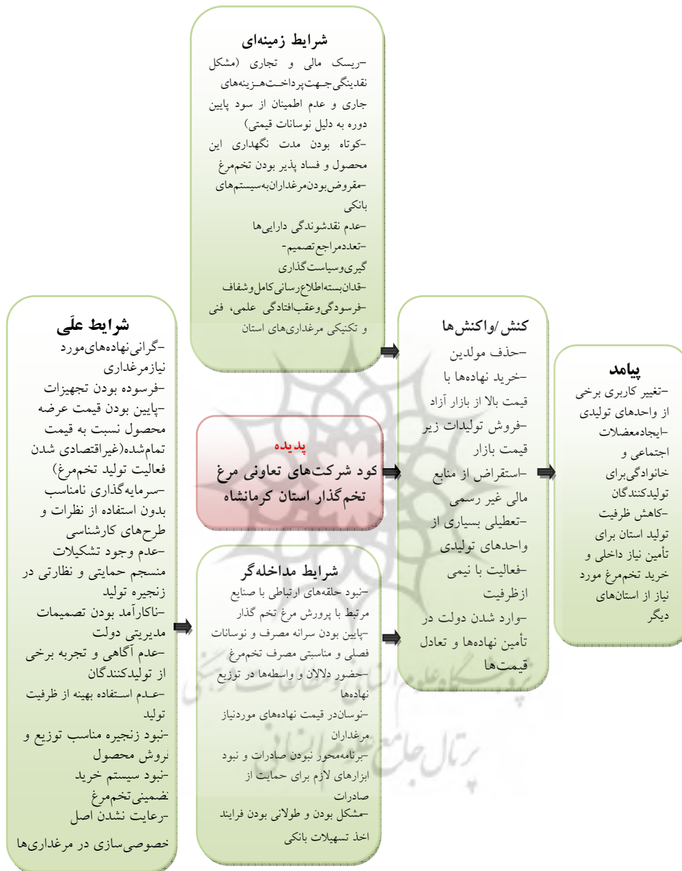
شکل ۲. مدل پارادایمی پدیده رکود شرکت‌های تعاونی مرغ تخم‌گذار استان کرمانشاه