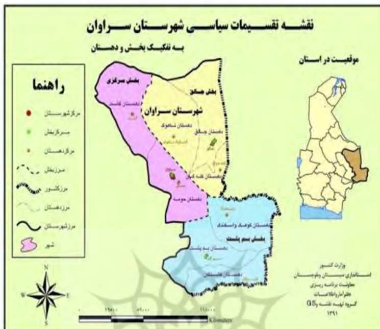
شکل ۲. نقشه تقسیمات سیاسی شهرستان سراوان