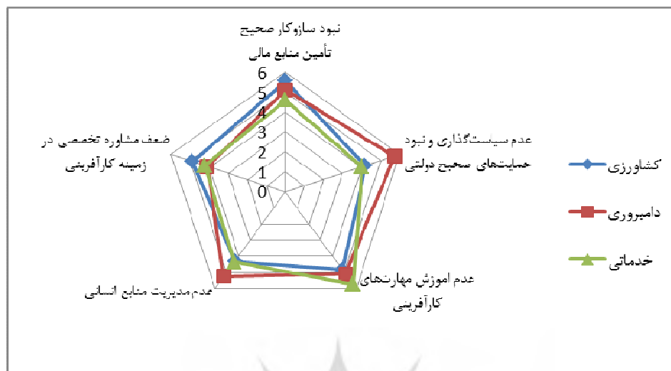
شکل ۱. مقایسه موانع زنجیره ارزش در بین کارآفرینان بر اساس حیطه فعالیت آنها