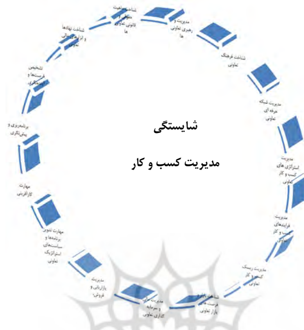
شکل ۴. شایستگی‌های مدیریت کسب و کار مدیران تعاونی

توسعه شایستگی اعضای هیئت مدیره تعاونی‌ها با شناسایی و تعیین نیازهای آموزشی و تحلیل فردی آغاز می‌گردد. در این خصوص، میزان آموزش بر حسب خواست عضو هیئت مدیره و نظر وی اولویت‌بندی می‌شود. در این بخش نیز برای توسعه شایستگی از فرصت‌های آموزش و یادگیری درون‌سازمانی و برون‌سازمانی بهره گرفته می‌شود. در بخش آموزش و یادگیری درون‌سازمانی بیشتر بر توسعه شایستگی‌های "فانونی و اقتصادی" اعضای هیئت مدیره تأکید می‌گردد و همچنین از روش انتقال تجربیات برای توسعه شایستگی "شناخت فرهنگ تعاونی" استفاده می‌شود و در بخش برون‌سازمانی از روش انتقال فناوری و تجربه از تعاونی‌های مشابه و رقیب بهره گرفته می‌شود (همان منابع).