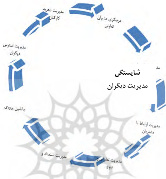
شکل ۳. شایستگی‌های مدیریت دیگران تعاونی

گروه دوم (مدیریت دیگران): در این طبقه شایستگی‌هایی چون مربیگری مدیران تعاونی، مدیریت و توسعه دیگران، مدیریت ارتباط با مشتریان، مدیریت تعارض و تنوع، مدیریت استعداد و جانشین‌پروری، مدیریت استرس دیگران و مدیریت تجربه کارکنان مطرح است.