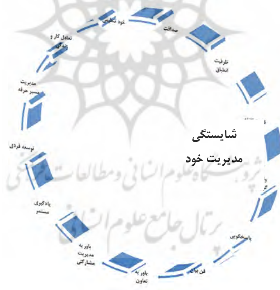
شکل ۲. شایستگی‌های مدیریت خود مدیران تعاونی

گروه اول (مدیریت خود): در این طبقه شایستگی‌هایی چون صداقت، ظرفیت انطباق، قدرت اقتناع، وظیفه‌گرایی، پاسخگویی، فن بیان، باور به تعاون، باور به مدیریت مشارکتی، یادگیری مستمر و توسعه فردی، مدیریت مسیر حرفه‌ای، تعادل کار و زندگی و خودتنظیمی مطرح است.