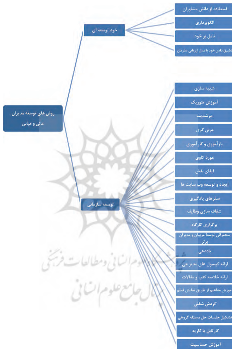
شکل ۲- روش های توسعه مورد نیاز برای توسعه شایستگی های مدل پژوهش (منبع: یافته های پژوهش)