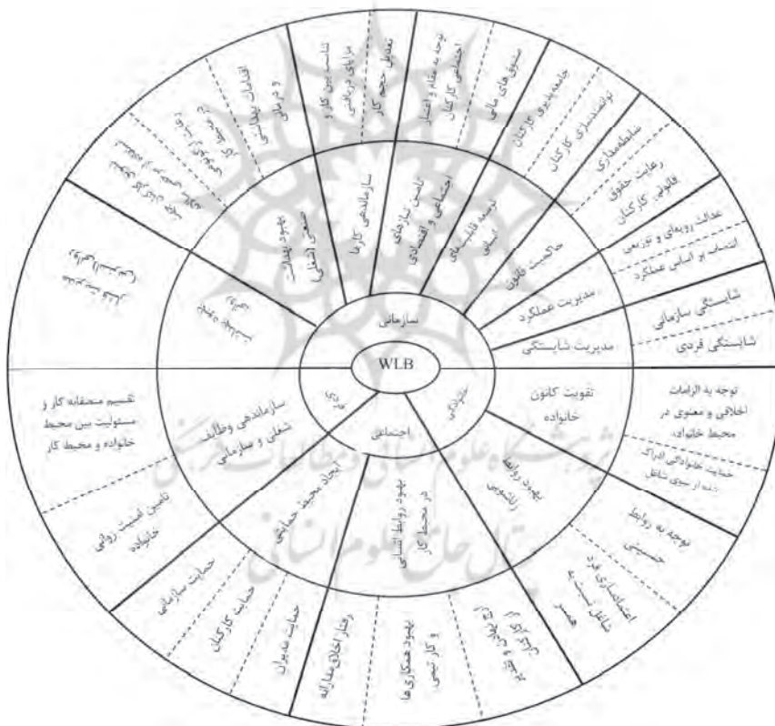
شکل ۱- الگوی بصری تحقیق برگرفته از انجام مصاحبه

با توجه به تحلیل داده‌های حاصل از انجام مصاحبه، الگوی تعادل کار-زندگی در شرکت مورد مطالعه به چهار طبقه یا سازه اصلی شامل: سازمانی، اجتماعی، فردی و خانوادگی تقسیم می‌شود. الگوی بصری تحقیق طبق شکل (۱) که در واقع، همان الگوی کدگذاری محوری است، توسط مدیران ارشد شرکت گاز استان مازندران طبق جدول (۷) مورد تأیید قرار گرفت.