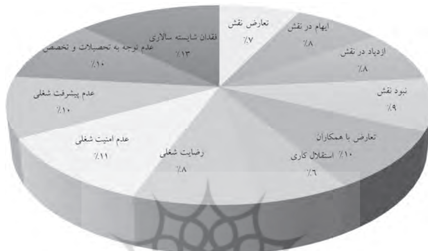
نمودار ۲- سهم کلی علل تشکیل‌دهنده ویژگی‌های شغلی مؤثر بر فرسودگی شغلی پاسخ‌دهندگان (منبع: یافته‌های پژوهش)