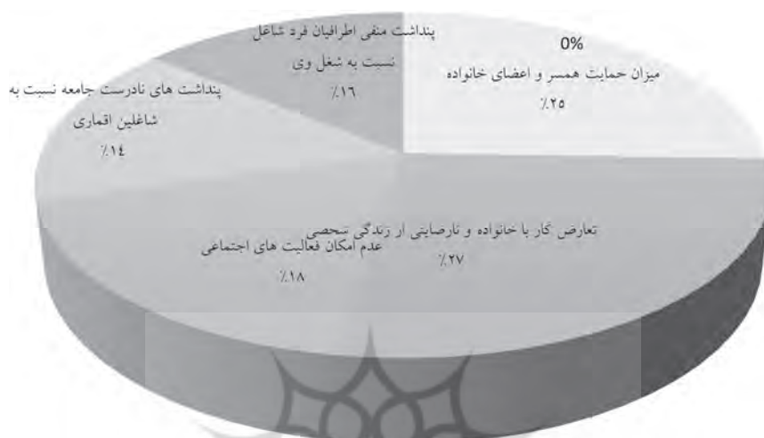
نمودار ۵- سهم کلی تشکیل‌دهنده علل اقتصادی و اجتماعی مؤثر بر فرسودگی شغلی پاسخ‌دهندگان

پنداشت‌های نادرست جامعه نسبت به شاغلین اقماری ۱۴ درصد علل «اقتصادی و اجتماعی» مؤثر بر فرسودگی شغلی را تشکیل می‌دهند.