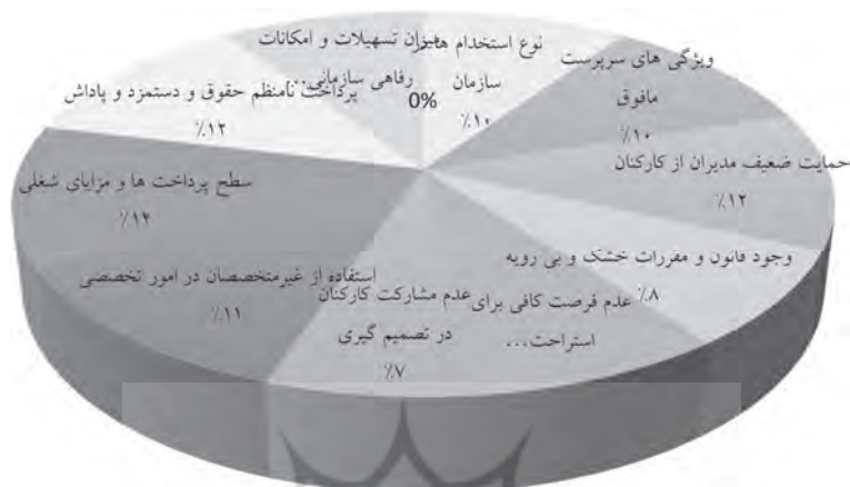
نمودار ۴- سهم کلی تشکیل دهنده علل ویژگی های سازمانی مؤثر بر فرسودگی شغلی پاسخ دهندگان

محیط کار ۲۰/۳ درصد علل مربوط به «محیط کار» مؤثر بر فرسودگی شغلی را تشکیل می دهند.