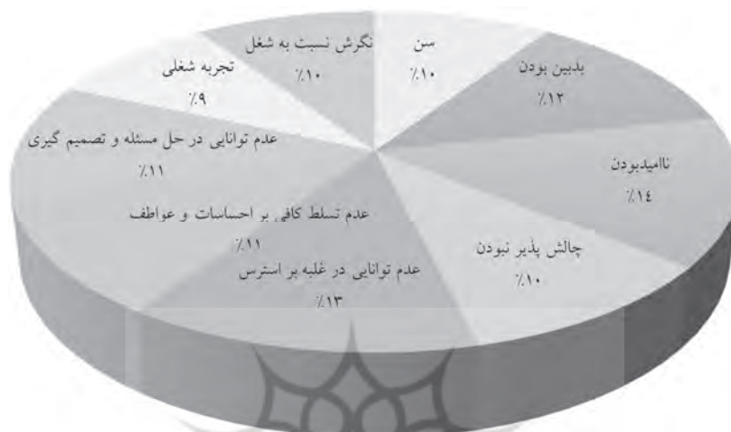
نمودار ۱- سهم کلی تشکیل دهنده علل فردی مؤثر بر فرسودگی شغلی پاسخ دهندگان (منبع: یافته‌های پژوهش)

از علل در طبقات مذکور به شرح زیر توضیح داده می‌شود: