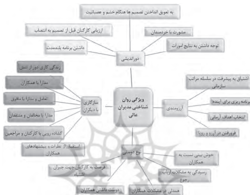
شکل ۱- مدل استخراجی ویژگی‌های روان شناختی مدیران عالی در صنعت نفت (منبع: یافته‌های پژوهش)

برای بررسی پایایی مدل انعکاسی بیرونی آزمون‌های آلفای کرونباخ، پایایی ترکیبی گلداشتاین (که هم‌بستگی درونی سؤالات هر متغیر (داخل مدل) را نشان می‌دهد) و پایایی اشتراکی (که هم‌بستگی درونی سؤالات درون مدل را مورد بررسی قرار می‌دهد) مورد سنجش قرار گرفت که با توجه به نتایج آزمون‌های پایایی، مدل بیرونی انعکاسی دارای پایایی سازه است. آزمون بعدی، آزمون‌های روایی همگرا و روایی واگرا بود. برای تأیید روایی همگرا بارهای عاملی بالاتر از ۷ درصد بود. میانگین واریانس استخراجی (AVE) که از جمله شاخص‌های اصلی بیان‌کننده همگرایی سؤالات یک پرسش‌نامه است، برای هر چهار مقوله بالای ۵ درصد بود و نهایتاً شرط سوم روایی همگرا هم (AVE > CR) توسط محقق بررسی و تأیید گردید که در جدول (۲) نشان داده شده است.