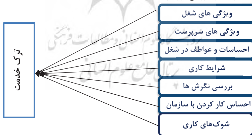
شکل ۱. مدل مفهومی تحقیق

همانطور که ملاحظه می‌شود عوامل متعددی بر ترک خدمت کارکنان تأثیر دارد که می‌توان در دسته‌های مختلفی آنها را طبقه بندی کرد. بر اساس توضیحات فوق و طبق نظر اساتید راهنما و خبرگان جامعه آماری تحقیق، اکنون مدل مفهومی تحقیق به شکل ۱-تدوین و مورد بررسی قرار گرفت.