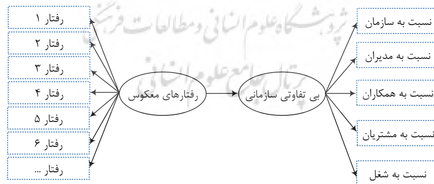
شکل ۲. مدل مفهومی پژوهش

بر اساس مبانی نظری بیان‌شده، مدل مفهومی پژوهش در شکل ۲ نشان داده شده است.