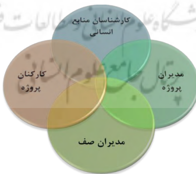
شکل ۱. چهاروجهی منابع انسانی بردین و سودرلوند، ۲۰۱۱

۱. مدیران صف: در ادبیات اخیر، به مدیران صف به عنوان بازیگران مهم اشاره شده است که مسئولیت ارزش‌آفرینی منابع انسانی در سازمان را عهده دارند.