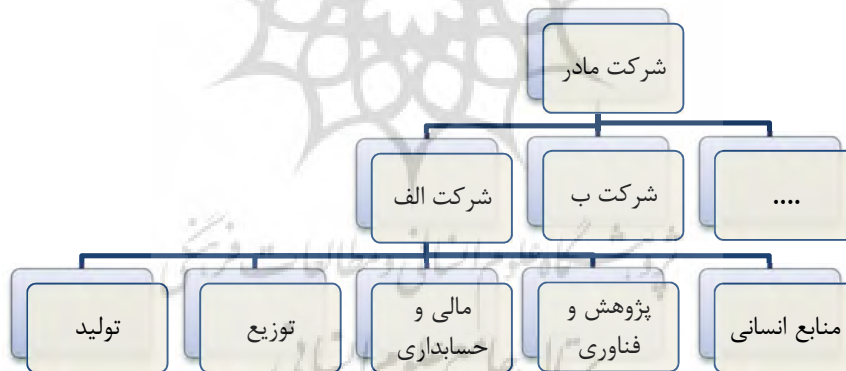
شکل (۱) سلسله مراتب سازمانی تصمیمات استراتژیک

در یک سازمان بزرگ فعالیت هایی که در زمینه تدوین، اجرا و ارزیابی استراتژی ها انجام میشود؛ در سه سطح از مدیریت (سلسله مراتب سازمانی) انجام میگردد. آن سه سطح مطابق با شکل (۱) عبارتند از : سطح مؤسسه، سطح بخش (واحد تجاری استراتژیک یا واحد کسب و کار) و سطح وظیفه ای. (غفاریان، ۱۳۸۹)