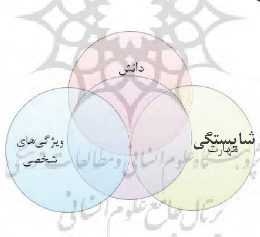
شکل ۱. مدل شایستگی‌های یونیدو

سازمان توسعه صنعتی ملل متحد (یونیدو) (۲۰۰۲) شایستگی را به سه دسته دانش، مهارت و ویژگی‌های شخصی تقسیم‌بندی کرد. سازمان ملل در تعریف، شایستگی را این‌گونه تعریف کرده است: "ترکیبی از مهارت‌ها، ویژگی‌های شخصی و شخصیتی و رفتارهایی که مستقیم با عملکرد موفق در یک شغل خاص مرتبط هستند". در شکل ۱ این شایستگی‌ها نشان داده شده است.