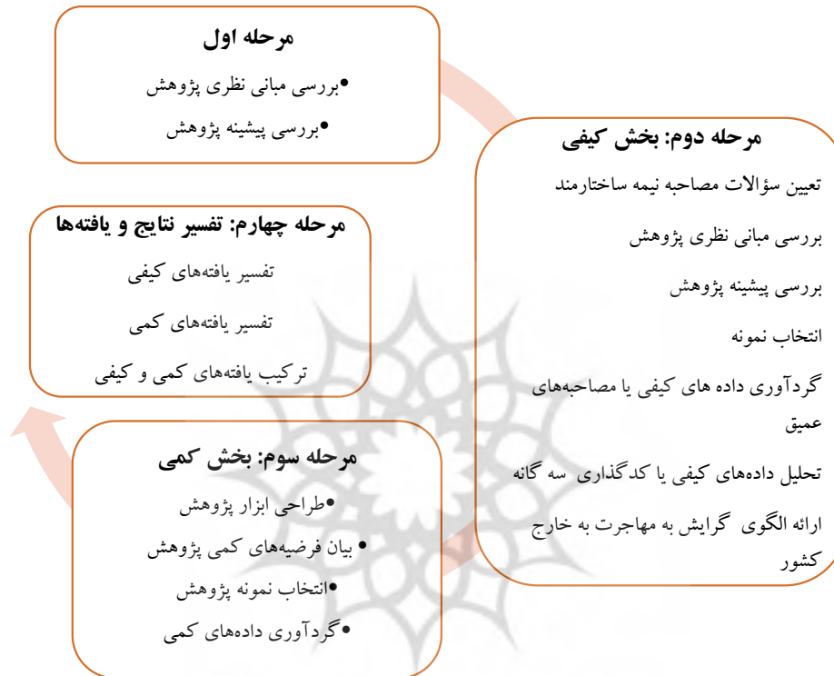
شکل شماره (۲) مراحل انجام پژوهش بر اساس رویکرد آمیخته

روش تحقیق حاضر، روش آمیخته ۱ بوده و از نظر هدف کاربردی و از نظر شیوه گردآوری داده های ترکیبی از نوع اکتشافی ۲ است که شامل دو مرحله عمده کیفی - کمی ۳ است. در مرحله اول از نظریه داده بنیاد ۴ (گراند تئوری) به عنوان رویکرد کیفی استفاده شد که روند مصاحبه ها تا اشباع