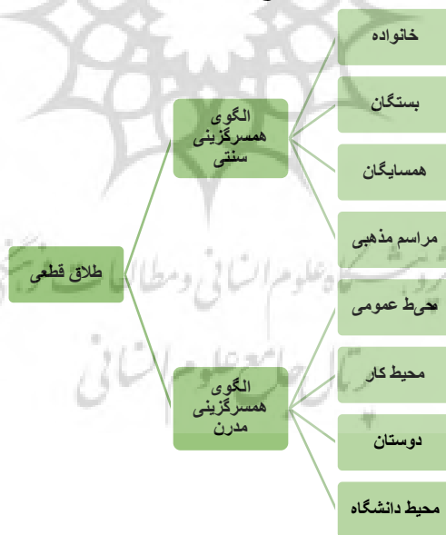
شکل ۱: مدل نظری تحقیق

در همسایگی است). در حالی که رابطه ناب به واسطه عشق و صمیمیت ساخته شده توسط طرفین تنظیم می گردد (ازدواج مدرن از قبیل انتخاب از سوی شخص دختر یا پسر، رابطه دوستی در محیط کار، رابطه دوستی در محل های بیرونی، رابطه دوستی در دانشگاه و غیره است). همین طور که گیدنز دو نوع الگوی سبک ازدواج سنتی و مدرن مطرح کرده است. طبق نظریه دیوید چیل نیز در خصوص طلاق، تغییرات اجتماعی به عنوان عامل عمده طلاق محسوب می شود. امروزه افراد بیشتر در جستجوی منافع و لذت های شخصی بوده و بهره مندی از فرصت های بهتر را جستجو می کنند به همین دلیل به سمت وسوی طلاق کشیده می شوند. حال با توجه به نظریه او تغییرات اجتماعی که در جامعه ایران به سرعت رخ داده است برخی جوانان سبک ازدواج خود را به صورت مدرن و برخی دیگر سنتی انجام می دهند و از آنجایی که میزان آمار طلاق در جامعه ایران بالا است، پژوهشگر در پی یافتن تفاوت ازدواج سنتی و ازدواج مدرن بر روی طلاق با یکدیگر است. با استفاده از نظریه های فوق دو فرضیه زیر مطرح و بر اساس متغیرهای تحقیق مدل نظری ارائه شد: به نظر می رسد تاثیر همسرگزینی سنتی با همسرگزینی مدرن در طلاق قطعی بایکدیگر متفاوت هستند. به نظر می رسد هر نوع همسرگزینی در طلاق قطعی تاثیر دارد.