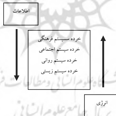
شکل (۱): رابطه میان خرده سیستم‌ها در نظام پیشنهادی پارسونز

پارسونز با استفاده از مفهوم کنش اجتماعی سلسله مراتبی را پیشنهاد می‌کند بدین معنا که خرده سیستم‌ها بر حسب غنای اطلاعاتی و فقر انرژی نظم یافته‌اند. (شکل ۱)