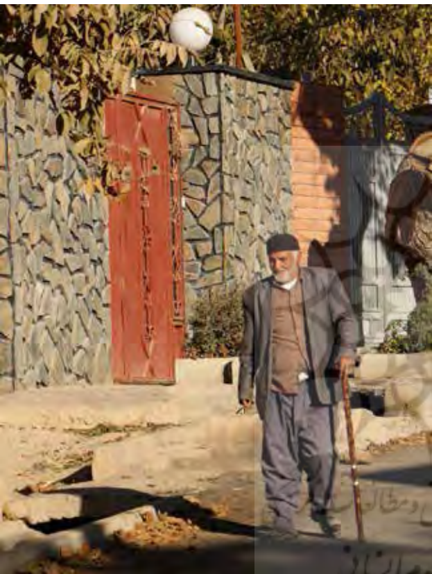
تصویر ۶. به کارگیری مصالح نوین و شیوه‌های ساخت شهری به گونه‌ای نامرتب با میراث منظر روستایی، استان کرمان.

نتیجه عوامل ذکر شده از جمله بلایای طبیعی، دستورالعمل‌های مدیریتی و تغییر نگرش ساکنان روستا، پدید آمدن منظر از روستاست که در هیچ‌یک از ابعاد، پیوندی با ساختارهای قدیمی روستا و منظر آن برقرار نساخته و بر این اساس خوانشی به نام روستا و منظر روستایی در مخاطب شکل نخواهد داد. در صورت عدم تغییر نگرش به روستا به مثابه میراثی غنی و فرهنگی و ادامه روند حاکم بر سیاست‌های نوسازی و بهسازی در زلزله‌خیزترین پهنة کشور، دیری نخواهد پایید که از هویت منظر روستایی استان کرمان چیزی برجای نخواهد ماند.