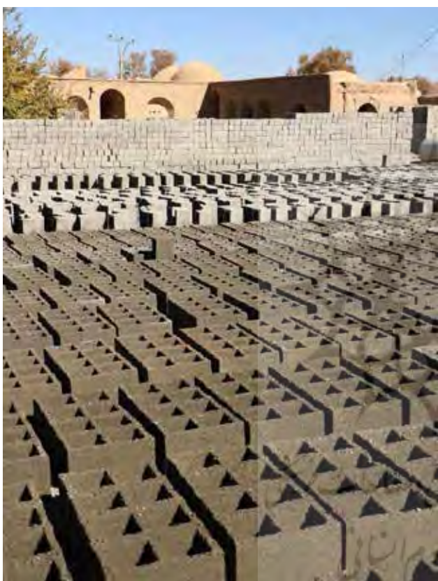
تصویر ۴. تحول منظر بومی روستا به دلیل تفاوت مصالح بومی و مصالح جدید، روستای اسماعیل‌آباد، کرمان. عکس: میثم خلیل‌پور، ۱۳۹۶.

زلزله‌های رخ داده در سال ۱۳۶۰ -مانند سیرچ و گلباف- نیاز به بازسازی مجدد از یک سو و دستورالعمل طرح هادی روستایی از سوی دیگر، توسعه روستاهای کرمان را به سمت سیاست‌های شهری و نه برنامه‌ریزی در مقیاس روستا سوق داد. ویرانی‌های ناشی از زلزله‌ها در سکونتگاه‌های روستایی این شائبه را ایجاد کرد که مصالح سنتی از دوام کمتری نسبت به مصالح جدید برخوردار هستند. بر این اساس شکل و صورت روستاها پس از عملیات نوسازی و بهسازی دستخوش تغییر شد، اما آنچه به عنوان نتیجه طرح‌های هادی در روستاهای زلزله‌زده استان کرمان باقی مانده