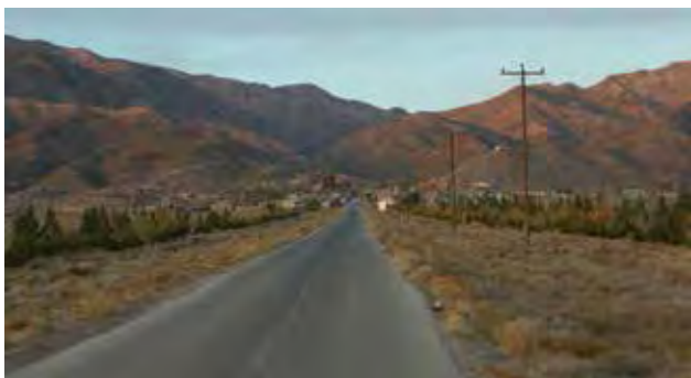
تصویر ۳. طرح کاشت جدید در جداره راه و مسیرهای دسترسی روستایی بدون پیوند با مؤلفه‌های هویتی روستا، روستای تیکدر، کرمان.