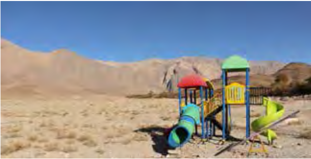
تصویر ۵. حضور مصادیق زندگی شهری در روستا به عنوان نمادهای جدید منظر روستایی، روستای سه کنج، کرمان. عکس: میثم خلیل پور، ۱۳۹۶.