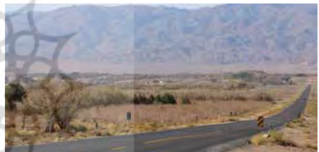
تصویر ۲. ارتباط بلافاصله زیرساخت‌های معیشتی و راه به عنوان عنصر ارتباط‌دهنده معیشت و زندگی در منظر روستایی، روستای راین، کرمان. عکس: میثم خلیل‌پور، ۱۳۹۶.

• زلزله: بازخوانی و بازشناسی تغییر منظر روستایی کرمان تاریخچه رخداد زلزله‌های تاریخی در استان کرمان و همچنین اهمیت زلزله‌های اخیر رخ داده در پیرامون کرمان همگی نمایانگر ویژگی این ناحیه از نظر لرزه‌خیزی است. در سده اخیر کرمان به عنوان مرکز زلزله‌های ایران، شاهد شدیدترین زمین‌لرزه‌های کشور بوده است. در سال ۱۳۶۰ به فاصله کمتر از دو ماه بخش وسیعی از استان کرمان به لرزه درآمد؛ زلزله اول به بزرگی ۶/۸ در مقیاس ریشتر به مرکزیت شهر «گلباف» رخ داد که موجب شد این شهر به کلی ویران شود. اما دومین زلزله که در ششم مرداد ماه ۱۳۶۰ به وقوع پیوست، با بزرگی ۷/۱ در مقیاس ریشتر شدیدترین زلزله استان کرمان و یکی از شدیدترین زمین‌لرزه‌های ایران محسوب می‌شود. این زلزله که در نزدیکی روستای «سیرچ» رخ داد به‌حدی شدید بود که در جریان آن حدود ۸۵ درصد بافت