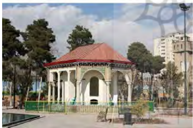
تصویر ۶. بالا: لیتوگرافی متعلق به ۱۸۴۰ م. عمارت کلاه فرنگی. پایین: گوشک هشت‌ضلعی، تنها بخش به‌جامانده از قصر قاجار در محوطه زندان قصر سابق.

و حقوقی بوده و زندان قصر به‌عنوان یک زندان مدرن در محل قصر قاجار سابق (به‌دلیل بیرون‌بودن از محدوده شهر) بنا شد (شمس، کریمیان و زرینی، ۱۳۸۴). ساختار زندان به‌شکل باغ بزرگی دور ساختمان اصلی زندان را احاطه کرده و دور باغ دیوارهای بلند زندان کشیده شده بود که آن را از خارج جدا می‌کرد (جهانشاه‌لو افشار، ۱۳۸۰). بنای ساخته شده نمونه‌ای از عناصر درشت‌دانه حکومتی-اداری مدرن ایران با ساختاری منسجم و نظام‌مند به سبک غربی است. این تحولات، قصر را به نمادی برای قدرت و انضباط، قانون‌مندی و حکومت دستوری تبدیل نمود.