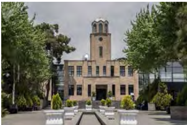
تصویر ۵. تبدیل قصر قاجار به زندان در دوره پهلوی اول.