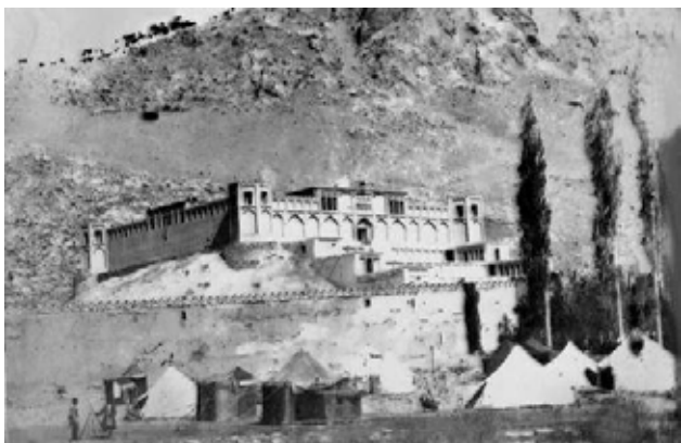
تصویر ۲. قصر قاجار به‌عنوان یک کاخ برون‌شهری با کارکردی تفریحی و مشرف بر طبیعت تهران.

وصف قصر قاجار در سفرنامه‌های متعددی ذکر شده و در ادبیات نیز شعرای بسیاری سروده‌هایی از زندان قصر داشته‌اند. ضرب‌المثل آب‌خنک خوردن، اشاره به کسی که به زندان می‌رود، برگرفته از وجود آب خنک قنات‌هایی بوده که از این زندان عبور می‌کرده است. علاوه بر این انتخاب هریک