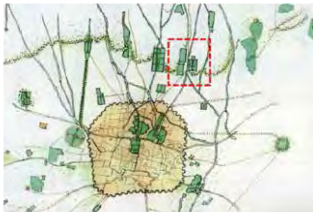
تصویر ۴. مکان‌یابی قصر قاجار در خارج از حصار شهر و در میانه جاده شمیران. مأخذ: خوانساری و همکاران، ۱۳۸۳.