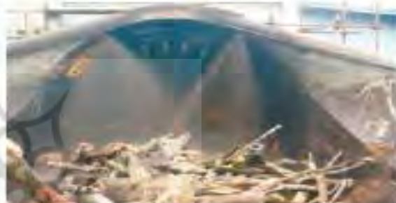
۴) کندن پوست تنه درخت