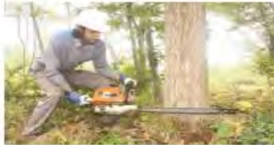
۲) بریدن درخت