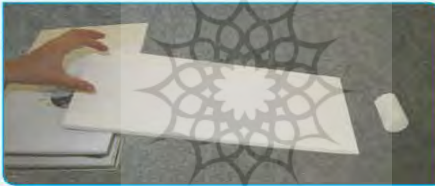
آزمایش روی سطح پرزدار