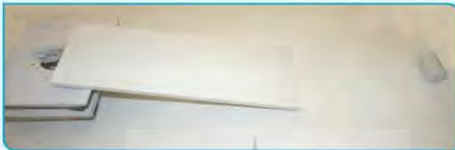
آزمایش روی سطح صاف

یک تخته‌ی صاف به طول تقریبی ۴۰ سانتی‌متر تهیه کنید و در یک سطح صاف مانند سطح سرامیکی، روی چند کتاب قرار دهید. جسمی مانند یک باتری قلمی را از بالای تخته رها کنید. جسم پس از طی چه مسافتی روی سطح صاف می‌ایستد؟ بار دیگر این آزمایش را روی سطح پرزداری مانند موکت تکرار کنید. این بار جسم پس از طی چه مسافتی می‌ایستد؟ اگر آزمایش را روی سطح ناهموار خاکی انجام دهیم، چه اتفاقی می‌افتد؟ اگر روی یخ انجام شود، چه اتفاقی می‌افتد؟ ● به نظر شما باید چه وضعیتی فراهم باشد تا جسم، مسافت بیشتری را طی کند؟ ● در کدام حالت جسم زودتر متوقف می‌شود؟ ● به نظر شما چرا در همه‌ی حالت‌ها، جسم پس از مدتی بالاخره می‌ایستد؟