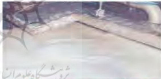
۶) تبدیل تکه‌های ریز چوب به خمیر و از بین بردن رنگ آن

۱- تغییرهای انجام‌شده در هر یک از مرحله‌های (۳) و (۶) فیزیکی است یا شیمیایی؟