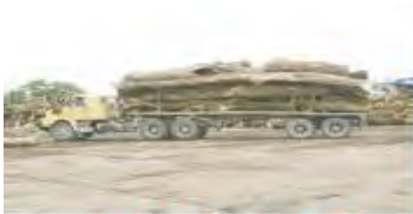
۱) حمل آوار چوب و تنه‌های درخت به کارخانه

از میان اجزای تشکیل دهنده درخت، فقط ساقه و تنه محکم و شاخه‌های چوبی درختان تنومند برای تهیه کاغذ مناسب است. در شکل‌های زیر، مراحل مختلف تبدیل درخت به کاغذ نشان داده شده است. با توجه به آنها و اطلاعاتی که جمع‌آوری کرده‌اید درباره‌ی هر مرحله در کلاس گفت‌وگو کنید؛ سپس به پرسش‌ها پاسخ دهید.