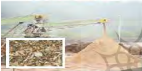
۳) تبدیل به تکه‌های ریز چوب (چپس چوب)