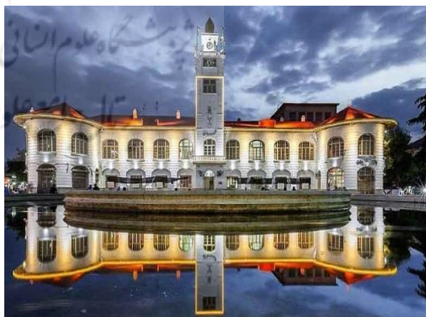
تصاویر ۳ و ۴- محدوده پیاده راه فرهنگی شهرداری رشت

از دیگر دلایل انتخاب این محدوده می‌توان به پتانسیل فعالیت‌پذیری و شکل‌گیری تعامل میان مردم و سطح بالای فعالیت اقتصادی در این محدوده اشاره نمود. این محدوده از شمال با بخشی از خیابان سعدی، از جنوب با بخشی از خیابان امام خمینی، و از غرب با کل خیابان علم‌الهدی ادغام شده است. میدان شهرداری رشت علاوه بر داشتن مرکزیت و محوریت اصلی، به دلیل برخورداری از بازار قدیمی و تاریخی