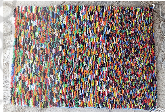
تصویر ۶: نمونه بافته شده بدون نقشه قالی پرو، بافت صغرا میر رحمتی.