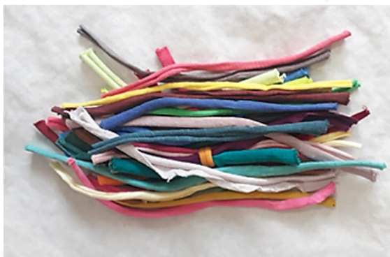
تصویر ۸: نمونه پارچه‌های کلاف شده موجود در بازار، معروف به «تریکو» (همان).

تغییر در مواد اولیه (استفاده از مواد اولیه سبک‌تر، مانند پارچه‌های حریر و کرباس) برای حمل و جابجایی آسان‌تر قالی گرو، یکی دیگر از تغییرات پیشنهادی می‌باشد. شکل سنتی قالی پرو استفاده از انواع پارچه‌ها، بدون در نظر گرفتن جنس و نوع آنها بوده که وزن دستبافته را سنگین کرده و به نوعی، در جابجایی آن مشکل ایجاد می‌نمود. با در نظر گرفتن مواد سبک و یکنواخت‌تر، می‌توان در رفع این مشکل اقدام نمود. تنوع مواد اولیه پارچه‌ها و نمونه‌های مشابه و جایگزین (پارچه‌های معروف به تریکو) با تعدد رنگی زیاد و قیمت مناسب که به صورت کلاف در بازار موجود می‌باشند، می‌توانند در روند تولید متنوع و نقشدار قالی پرو موثر باشند (تصویر ۸).