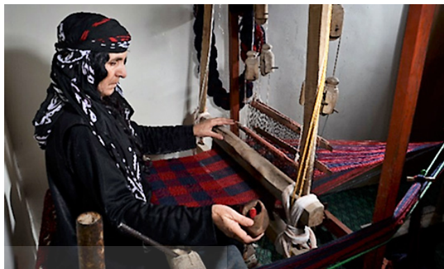
تصویر ۴: نمونه‌ای از نحوه نامناسب تابش نور و عدم وجود نور کافی در کارگاه بافندگی (عکس از مهدی کرندی). تصویر ۵: نمونه‌ای از مکان نامناسب برای بافنده (همان).