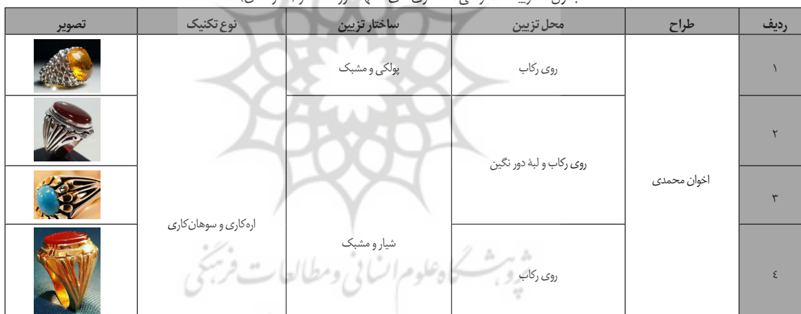
جدول ۶. تزیینات هندسی انگشتری‌های مشهد دوره معاصر (نگارندگان).