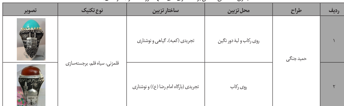
جدول ۹. اماکن مقدس بر انگشتری‌های مشهد دوره معاصر (نگارندگان).

در انگشترسازی معاصر مشهد، رکاب‌های بازاری غالباً از جنس نقره و رکاب‌های سفارشی از فدیوم بوده که یک تکه و بدون جوش هستند. بیش‌تر این رکاب‌ها با کارهای هنری از قبیل قلمزنی همراه هستند و این مسأله باعث خلق سبک جدید و خاص مشهد شده است. هنرمندان انگشترساز مشهدی، تزیین آثار را به صورت کنده‌کاری و مثبت‌کاری انجام می‌دهند و نقوش، قلمزنی می‌شوند تا برجسته شده و فرم سه‌بُعدی به خود بگیرند. هم‌چنین، بیش‌ترین مضامین به کار رفته، ادعیه، اذکار، نقوش گیاهی، حیوانی، پرنده و اماکن مقدس است که در بین افراد مذهبی بیش‌ترین خواستار را دارد. بیش‌ترین نگین‌هایی که روی رکاب سوار شده، فیروزه و عقیق هستند با اعتقادات حاصل از احادیث شیعی مرتبط هستند. حرفه انگشترسازی در گروه صنایع کوچک جای دارد و با آموزش و تولید اشتغال در فعالیت‌هایی از قبیل رکاب‌سازی، تراش نگین و ... در کارگاه‌های خانگی، رونق پیدا کرده است.