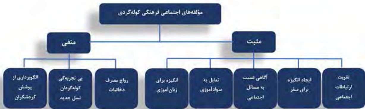
تصویر ۳. نقشه تحلیل تماتیک.

کوله‌گردها در کمک به پایداری و کنترل محیط جوامع محلی) همراستاست.