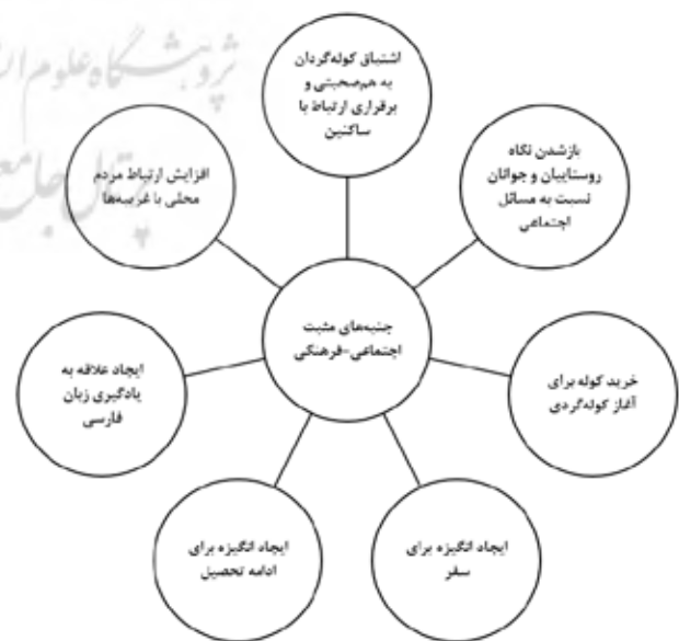
تصویر ۲. نمونه‌ای از ترکیب کدها برای جنبه‌های مثبت اجتماعی-فرهنگی کوله‌گردی.