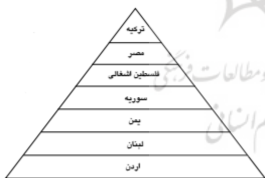
شکل (۲): وضعیت سطح بندی قدرت در جنوب غرب آسیا و حاشیه‌مدیرانه

بنابراین عدم توازن قوا ویژگی اصلی منطقه جنوب غرب آسیا و حتی خاورمیانه بوده و هست و در چنین فضای نابرابری طبیعی است که هر تحرک و دگرگونی قدرتی زنجیره‌ای از کنش‌ها و واکنش‌ها را به دنبال دارد و به تعبیر والت معمای امنیت را ایجاد می‌کند. پیامد ایجاد معمای امنیتی در منطقه بدون تردید بی ثباتی