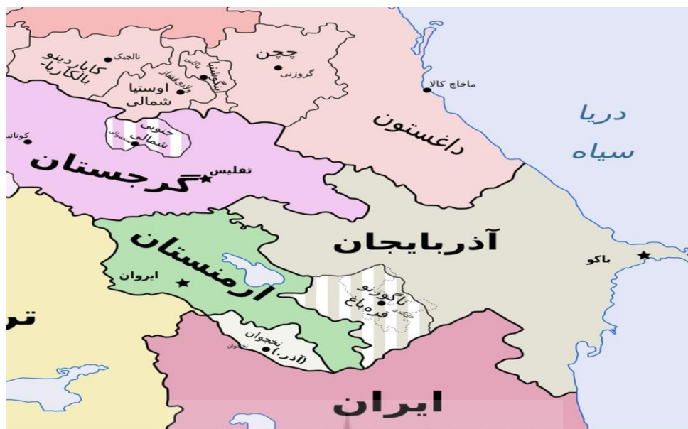
نقشه (۱): نقشه قفقاز

دلایل اهمیت استراتژیکی و ژئوپلیتیکی منطقه قفقاز چیست؟