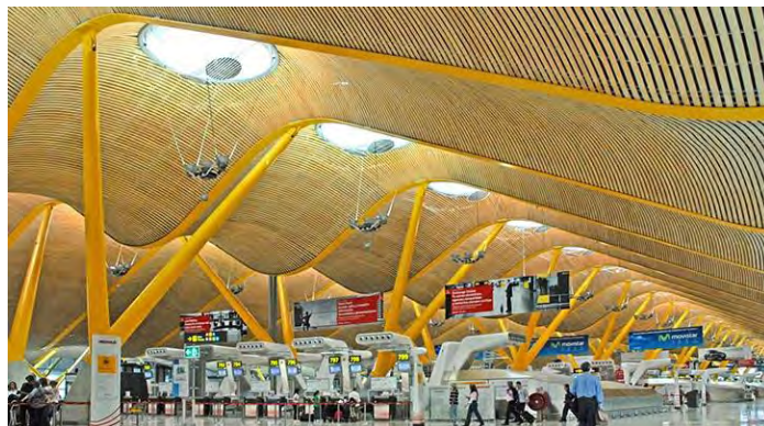
شکل ۴. فرودگاه Barajas - توسط ریچارد راجرز و lamella استودیو نمونه‌ای عالی از ریتم می‌باشد که از طریق تکرار و پیشرفت رنگ حاصل می‌شود.

در طراحی داخلی، ریتم تنها در مورد تکرار عناصر طراحی که به ایجاد حرکت در فضا کمک می‌کنند استفاده می‌شود. این ریتم ممکن است در عرصه‌های جسورانه اعمال شود که یک پیشنهاد آشکار در مورد مسیر طراحی را ایجاد می‌کند و یا دقیق‌تر از آن استفاده می‌شود تا چشم را در مورد فضایی بدون اینکه حتی جلب توجهی که ریتم آنجا وجود دارد، حرکت دهد. چگونه هماهنگی با آهنگ و عمق یک آهنگ درست می‌شود؟ هر نغمه "رنگ" خاص خود را دارد و به نظر می‌رسد که مسیر حرکت نیز دارد. همچنین ریتم را می‌توان از طریق پیشروی به دست آورد. برای مثال یک درجه‌بندی رنگ و یا مجموعه‌ای از اشیاء هستند که کوچک می‌شوند و به روش بسیار منظم بزرگ می‌شوند (شکل ۴).