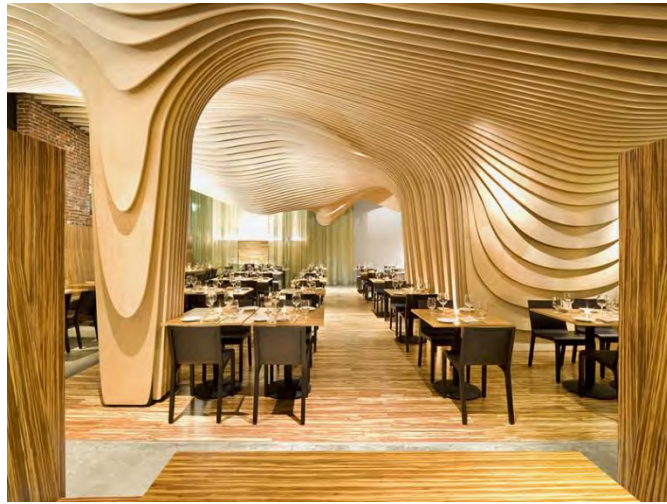
شکل ۲. تکرار چوب بر روی دیوار این رستوران یک ریتم سرزنده را ایجاد می‌کند و چشم شما را از طریق فضا می‌کشد

تناوب برای ایجاد ریتم به وسیله دو یا چند عنصر متناوب در یک الگوی منظم به کار می‌رود. این الگو ممکن است ABCABC یا ABBABB باشد، اما همیشه به همان ترتیب تکرار می‌شود (شکل ۳).