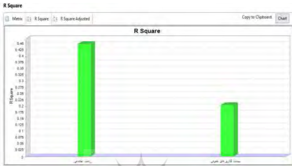
شکل شماره (۳) معیار R squares