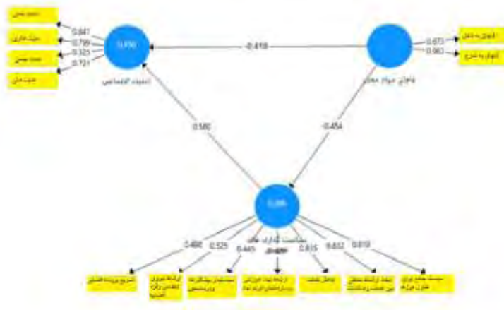
شکل (۱) تکنیک حداقل مربعات جزئی مدل کلی پژوهش

پژوهشگاه علوم انسانی و مطالعات فرهنگی پرتال جامع علوم انسانی