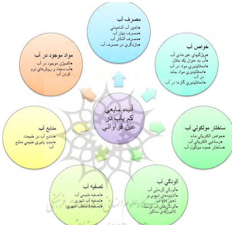
شکل ۱. نمونه‌ای از نقشه مفهومی (فصل اول کتاب شیمی اول دبیرستان)

نرم افزار «تزاروس بیلدر» یکی از نرم افزارهای مناسب برای ساخت و مدیریت اصطلاح نامه است. اطلاعات مربوط به واژه‌ها، که بر اساس نقشه مفهومی گردآوری شده، در قالب ساختار رده‌ای وارد نرم افزار می‌شود و پس از انجام فرایندهای ذکر شده در جدول ۱، انواع ساختارهای اصطلاح نامه‌ای، مانند نمایه الفبایی، نمایه سلسله مراتبی، نمایه گردان، و نمایه واژه‌ها از آن به دست می‌آید. نگاه کنید به شکل ۲.