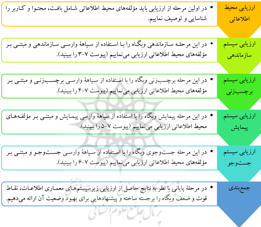
شکل ۲. فرایند ارزیابی معماری اطلاعات و بگانه

کرد. بدین ترتیب، سیستم معماری اطلاعات حاصل از این زیرسیستم‌ها با ایجاد تعادل بین مؤلفه‌های محیط اطلاعاتی به‌دنبال قابل پیدا کردن و قابل فهم کردن اطلاعات است. با توجه به آنچه گفته شد، می‌توان فرایند ارزیابی معماری اطلاعات و بگانه را مبتنی بر چارچوب پیشنهادی و با کمک مؤلفه‌های محیط اطلاعاتی و ابعاد سیستم معماری اطلاعات به‌صورت شکل ۲، تبیین کرد.