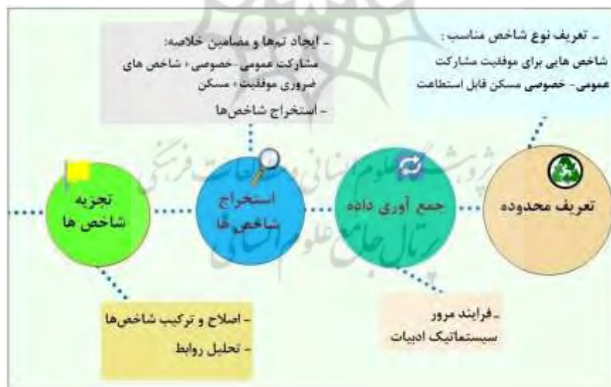
شکل (۱): فرایند انتخاب شاخص‌های کلیدی بر اساس طرح کارالی و همکاران (۲۰۰۴)

در انجام این پژوهش سه گام اصلی (مطابق شکل ۱) طراحی شده است. در گام نخست "مرور سیستماتیک ادبیات" با روش تحلیل محتوا در زمینه انتخاب، استخراج، تحلیل و ترکیب داده‌های منتشرشده، مورد استفاده قرار گرفت. در این تحلیل، ما از رویکرد تحلیل محتوای تلخیصی بهره بردیم. انتخاب داده‌ها شامل جستجوی منظم برای اسناد مرتبط با مشارکت عمومی-خصوصی مسکن قابل-استطاعت بود که بین سال‌های ۲۰۰۰ تا ۲۰۲۰ انجام پذیرفت. کلیدواژه‌هایی که در این بررسی مورد استفاده قرار گرفت شامل "مشارکت عمومی-خصوصی"، "فاکتورهای ضروری موفقیت" و "مسکن قابل استطاعت" می‌باشند که به شکل ترکیبی استفاده شده‌اند. تعداد کل اسناد مورد بررسی ۱۷۴ مورد بود؛ که از پایگاه‌های علمی Science Direct, Springer, Taylor Francis و Google scholar گردآوری شده‌اند. بعد از حذف موارد تکراری و نامرتب، با خواندن چکیده و مقدمه اسناد، ۲۶ مقاله توسط تیم پژوهش برای هدف مورد نظر مناسب تشخیص داده شد. در این فاز ضمن مفهوم‌پردازی موضوع و شناسایی شکاف دانش به کشف معیارهای موفقیت برای مشارکت عمومی-خصوصی مسکن قابل استطاعت پرداخته شد. در زمینه‌ی استخراج معیارهای مورد نظر، نویسندگان چهار فعالیت اساسی را براساس تجزیه و تحلیل کارالی ۱ و همکاران (۲۰۰۴) شناسایی کرده‌اند؛ که شامل مراحل زیر است: (۱) تعریف محدوده، (۲) جمع‌آوری داده‌ها (۳) استخراج شاخص‌ها و (۴) تجزیه و تحلیل روابط شاخص‌ها. لازم به ذکر است که تمامی مراحل بالا در نرم‌افزار Nvivo نسخه ۱۰ به عنوان یکی از بهترین نرم‌افزارهای مدیریت تحلیل‌های کیفی صورت پذیرفته است.