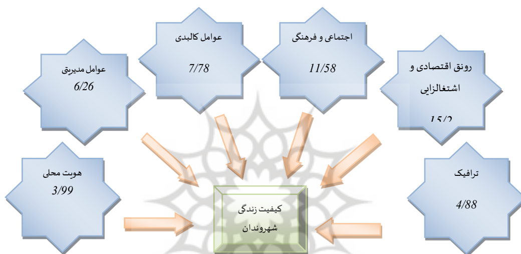
شکل ۲- عوامل اثرگذار بر کیفیت زندگی شهروندان بر اثر حضور گردشگران خارجی

همانطور که در جدول ۸ ملاحظه می‌شود، اثرات گردشگری مذهبی خارجی بر منطقه ثامن مشهد دسته بندی شد. در این دسته بندی «رونق اقتصادی و اشتغالی» در منطقه با ۱۵/۲٪ از واریانس به عنوان مهمترین عامل در نتیجه گردشگری مذهبی منطقه ثامن شناخته شده است. بعد از آن به ترتیب عوامل ۲ -