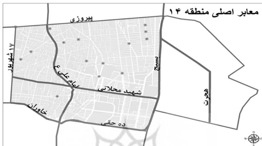
نقشه شماره (۲). نقشه معاير اصلی منطقه ۱۴.

(۳۵) درجه و (۴۱) دقیقه و (۳۴) ثانیه تا (۳۵) درجه و (۳۹) دقیقه و (۲۳) ثانیه قرار گرفته است.