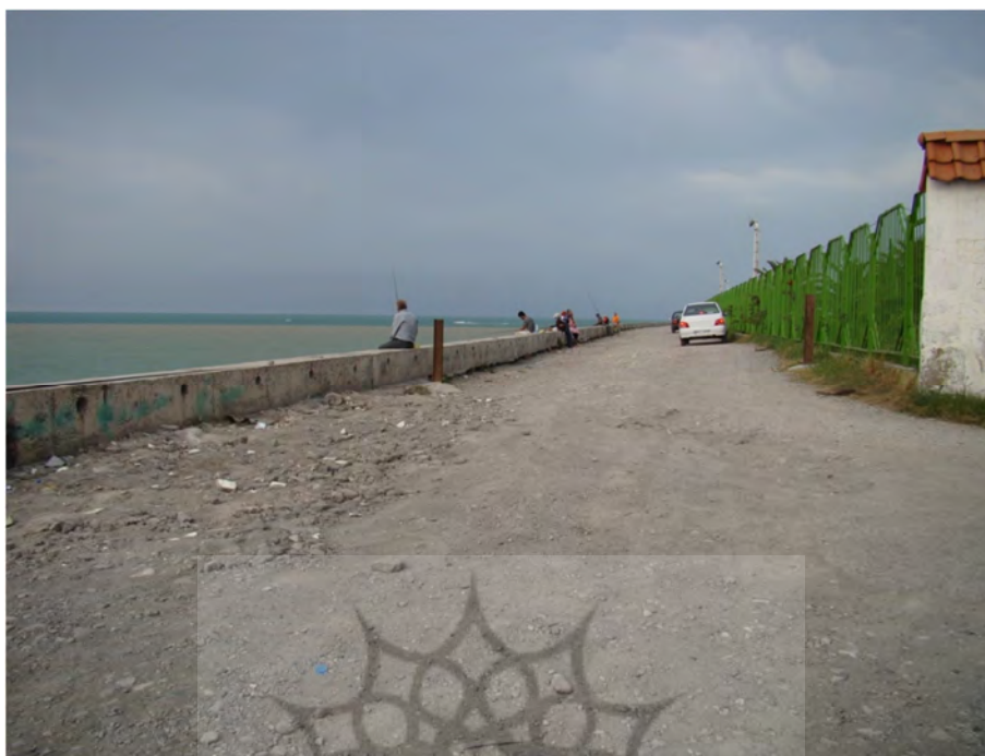
عکس شماره (۲). سردآبرود، معابر نامناسب و روشنایی نامناسب.