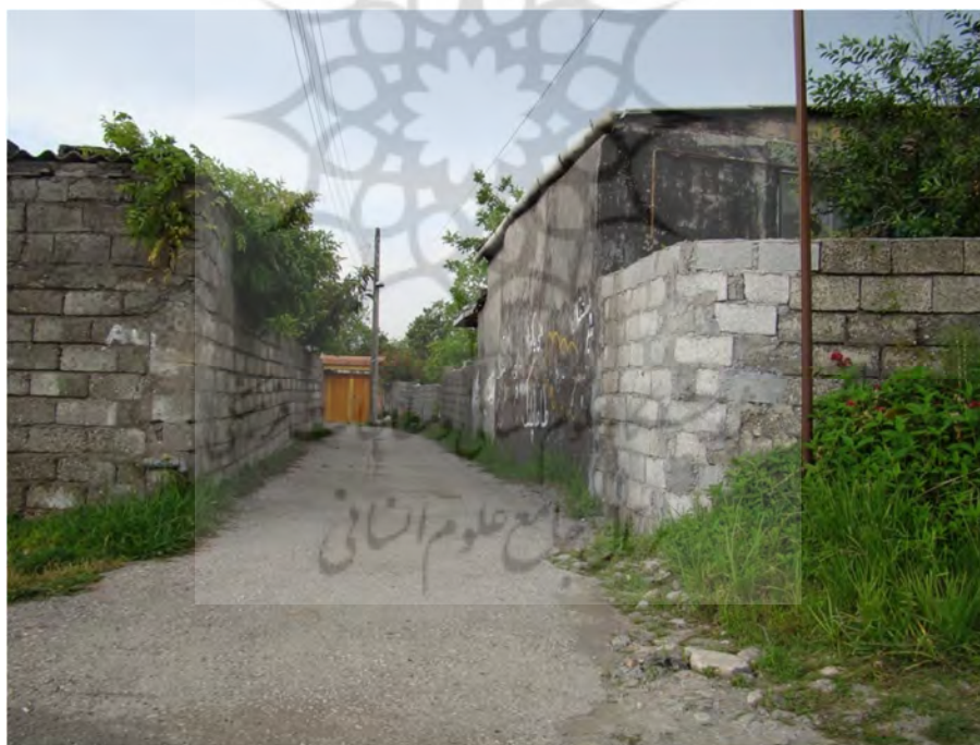
عکس شماره (۱). جوکی محله نادری، کوچه باریک و احساس ناامنی ساکنان به خصوص در ساعات تاریکی.

نتایج آزمون اسپیرمن نشان می‌دهد که بین روشنایی و احساس امنیت رابطه معناداری وجود ندارد. باوجوداینکه در مبانی نظری پژوهش وجود روشنایی در ارتقا کیفیت محیطی تأثیرگذار بوده و در افزایش احساس امنیت مؤثر است ولی در شهر چالوس این اصل اثبات نمی‌شود و تأثیر معنی داری در ارتقا امنیت شهری نداشته است.