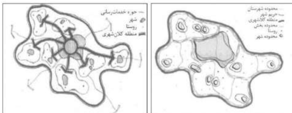
شکل ۲- تفرق سیاسی (سمت راست) و یکپارچگی و همبستگی عملکردی (سمت چپ) در منطقه کلان‌شهری تهران؛ (منبع: مرکز مطالعات و برنامه‌ریزی شهر تهران، ۱۳۸۵)

اگرچه در ساختار اداری برای تعدیل و هماهنگ‌سازی عملکرد بخشی وزارتخانه‌ها و سازمان‌های دولتی و ایجاد هماهنگی‌های بین‌بخشی، سازمان‌های هماهنگ‌کننده با ماهیت و عملکرد میان‌بخشی وجود دارند، اما تمرکزگرایی موجود در این سازمان‌ها و بی‌توجهی به سازمان‌های محلی و نقش آن‌ها در اجرای برنامه‌ها در کنار فقدان ماهیت فضایی - مکانی هماهنگی‌ها سبب شده است تا مسأله هماهنگی نهادی با مشکلات زیادی مواجه شود. وزارتخانه‌های موجود، دارای ماهیت و عملکرد بخشی هستند و تمامی امور خود را از مرکز اداره می‌کنند. در این وضعیت جریان تصمیم‌گیری به صورت یک‌طرفه و عمودی است. سازمان‌های استانی یا شهرستانی عموماً فاقد قدرت تصمیم‌گیری و تصمیم‌سازی هستند. بنابراین دو نظام مدیریت ملی و محلی کشور با خصوصیات متفاوت در کلان‌شهر تهران بدون هماهنگی با یکدیگر عمل می‌کنند (پیشگاهی‌فرد و همکاران، ۱۳۹۲: ۱۰۳). در واقع محدوده منطقه کلان‌شهری تهران با بیش از ۳۸ شهرداری مستقل، به مجمع‌الجزایری از مدیریت‌های شهری و مستقل اما کاملاً نزدیک و ناهماهنگ با یکدیگر تبدیل شده است. مجمع‌الجزایری که محدوده‌های حفاصل بین آن‌ها نیز خود تحت مدیریت نهادهای مستقل دیگر (فرمانداری‌ها) قرار دارند (عسگری و همکاران، ۱۳۸۳: ۹۸).