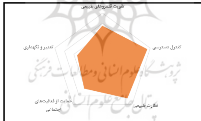
شکل ۳. نمودار وزن نهایی شاخص‌ها