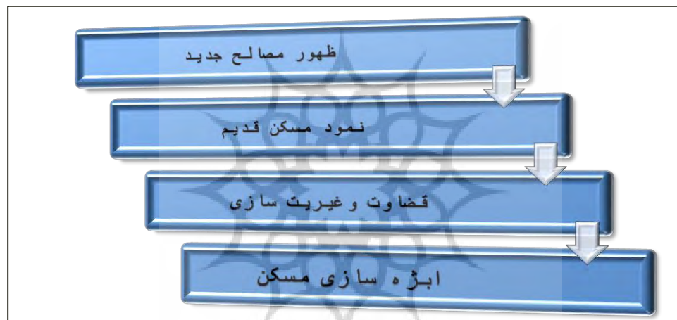
شکل ۲. فرایند اثره سازی گفتمان شهر مدرن

کنند. آن‌ها به امری روئیت پذیر تبدیل شدند. در نهایت، بزرگنمایی مساکنی که تا آن زمان در عین حضور، از چشم‌ها به دور بوده‌اند، وظیفه‌ای است که کارگزاران گفتمان در قالب محققان، بر عهده گرفتند. بنا به تاریخ ارزنده‌ای که شادروان دکتر محمدحسن گنجی در کتاب "جغرافیای ایران از دارالفنون تا انقلاب اسلامی" ارائه کرده‌اند، جغرافیای ایران تا سال ۱۳۵۴، شناختی که از شهر ارائه می‌کند، مختص "مسکن" است. گویا مسکن و نظم هندسی، تنها امر قابل مطالعه در شهر بوده است. بنا به تاریخی که استاد روایت می‌کند، در برنامه آموزشی گروه جغرافیا که دانشگاه تهران در سال ۱۳۵۴ برای دوره لیسانس ارائه می‌کرد، نامی از جغرافیای شهری نبود. در صورتی که "جغرافیای مسکن" یکی از دروس ارائه شده بود (گنجی؛ ۱۳۶۷). و جالب این که سرفصل درس جغرافیای مسکن شامل دو قسمت بود که قسمت اول آن به معرفی مسکن به شکل عام آن می‌پردازد و قسمت دوم به تعریف شهر می‌پردازد. گو این که مسکن تنها دلیل و گزاره شناخت شهر از نا شهر است، و تا قبل از مطالعه مسکن، شناخت شهر امکان‌پذیر نیست؛