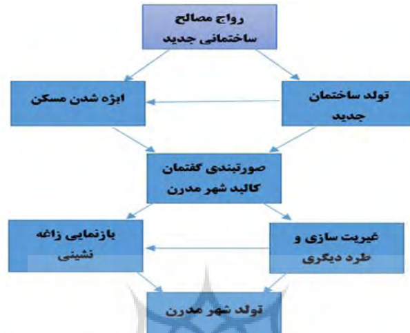
شکل ۲. فرایند تولد شهر مدرن به‌منابه کالبد

که تا دیروز با لایه‌هایی از محرمیت پنهان شده بود، امروزه خواسته و ناخواسته، تمام راز و اسرار خود را در به دستان نقشه‌کشان سپرد، زیرا آنان که معماری و شهرسازی خوانده‌اند، طیب فضا شده‌اند و در محضر پزشک محرمیت فرومی‌ریزد. همه اجزاء خانه، راه‌پله‌ها، سایبان‌ها، انبارها، اتاق‌ها و... باید مطابق میل و سلیقه گفتمان چیده شوند، هر کس چیزی را مخفی کند، در محضر قانون ماده صد مجرم شناخته می‌شود و باید غرامتی را به‌عنوان اقدام علیه امنیت گفتمان پرداخت کند.