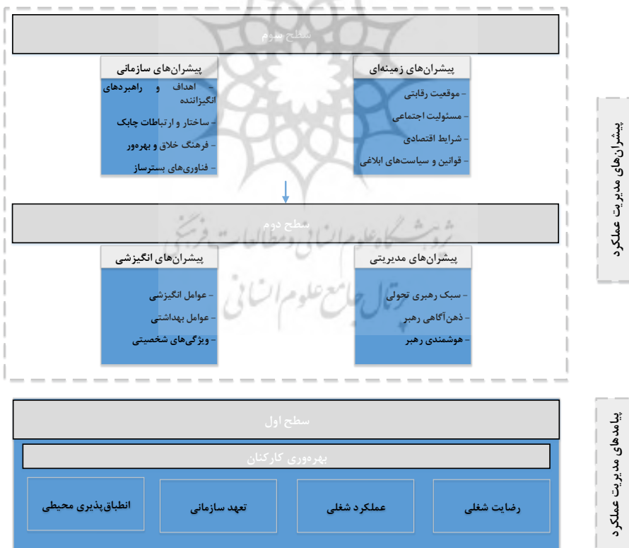
شکل (۱) مدل پیشران‌های مدیریت عملکرد با رویکرد بهره‌وری کارکنان احصاء شده از مرحله ISM

در این مرحله بر اساس سطوح تعیین شده در مرحله قبل و ماتریس دستیابی نهایی، مدل ساختاری- تفسیری پژوهش ترسیم می‌شود. یافته‌های حاصل از سطح‌بندی عوامل نشان داد که، عامل ۵ (بهره‌وری کارکنان) در سطح اول مدل قرار گرفته است و این به معنای آن است که این مقوله تأثیرپذیرترین عامل می‌باشد که از همگی عوامل دیگر تأثیر پذیرفته و بر عاملی تأثیر نمی‌گذارد. در سطح دوم عامل ۳ (پیشران‌های مدیریتی) و عامل ۴ (پیشران‌های انگیزشی) قرار گرفته‌اند که بر عامل سطح پنجم تأثیر گذاشته و از عوامل سطح سوم تأثیر می‌پذیرند. در نهایت در سطح سوم عامل ۱ (پیشران‌های زمینه‌ای) و عامل ۲ (پیشران‌های سازمانی) قرار دارند که تأثیرگذارترین عوامل در بین عوامل موجود در مدل پژوهش می‌باشند. در نهایت با توجه به سطح‌بندی عوامل یاد شده، مدل نهایی ساختاری- تفسیری مربوط به پیشران‌های مدیریت عملکرد با رویکرد بهره‌وری کارکنان در صنعت هواپیمایی کشوری در شکل (۱) ارائه شده است: