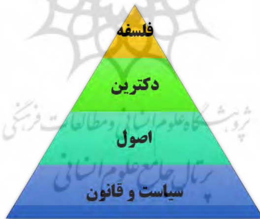
شکل ۱: سلسله‌مراتب اسناد سیاستی در کشور

از لحاظ مفهوم شناسی، بیانیه ۱ یا مرام‌نامه، نوشته‌ای است که در آن، یک گروه یا حزب، نظریات سیاسی، اجتماعی، مذهبی، فلسفی و یا ادبی خود را اعلام می‌کند. لذا مقام معظم رهبری با نام‌گذاری متن مذکور ذیل عنوان بیانیه، قصد داشتند تا دیدگاه جامعی از روند گذشته و آینده انقلاب اسلامی ارائه داده و ضمن بیان توصیه‌های اساسی به‌منظور ساخت ایران اسلامی، اداره انقلاب را از نسل گذشته به نسل جوان کشور واگذار کنند (نصرت پناه، ۱۳۹۸: ۴۰). در نظام سیاست‌گذاری جمهوری اسلامی مطابق با سطح تصمیم‌گیرندگان، اسناد سیاستی مختلفی تدوین می‌شد. می‌توان سلسله‌مراتب اسناد سیاستی در کشور را در چهار سطح فلسفه ۲ ، دکترین ۳ ، اصول ۴ و سیاست ۵ تقسیم‌بندی نمود. فلسفه، روح حاکم بر کل نظام سیاست‌گذاری را مشخص می‌کند و بعضاً قوانین نانوشته‌ای؛ در خصوص ارزش‌های حاکم بر نظام‌های سیاست‌گذاری است. نمود عینی فلسفه حاکم بر نظام سیاست‌گذاری در دکترین مشهود است.