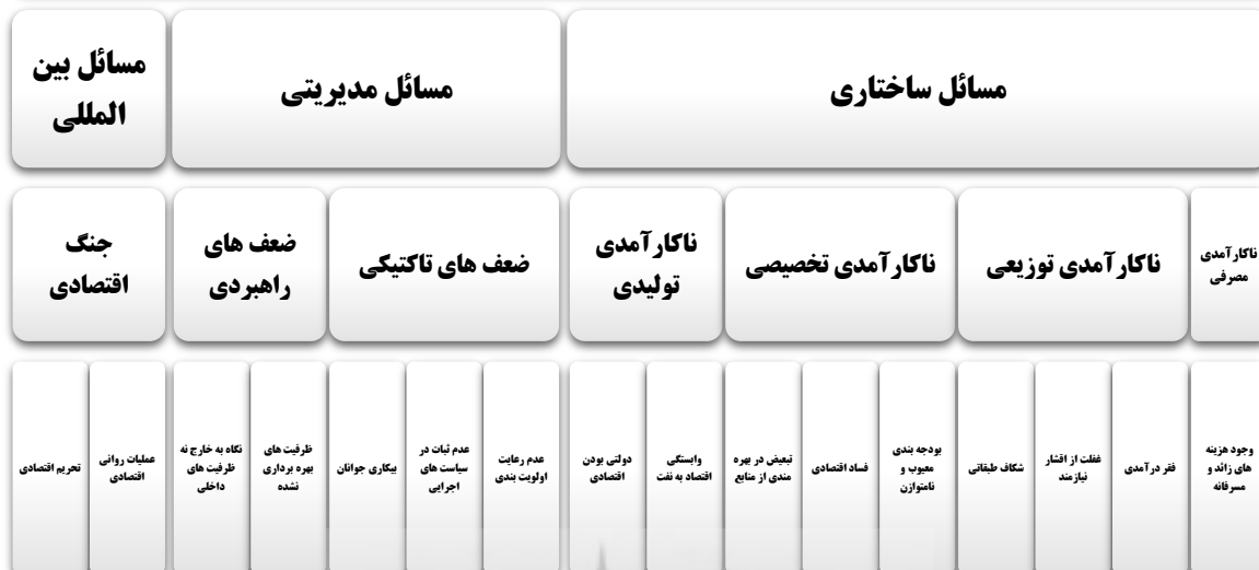
شکل ۲: نمودار مضامین حکمرانی اقتصادی