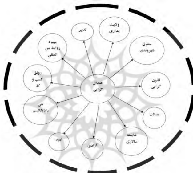
شکل شماره (۱). منظومه معنایی گفتمان نواصلاح‌طلبی

اما در عمل و کارنامه عملیاتی‌سازی این گفتمان برپایه فضای استعاری وعده داده شده‌اش، چه اتفاقی افتاد؟