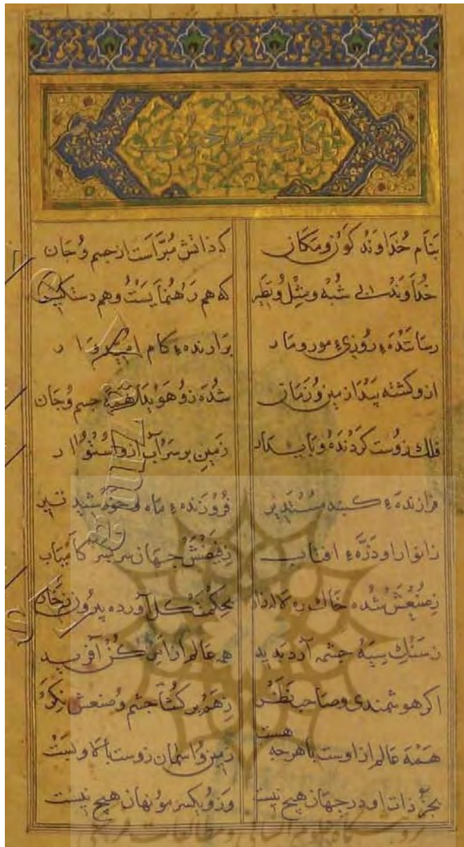
صفحة اول نسخه عاطف افندی