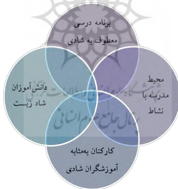
شکل ۳: الگوی مدرسه شاد ایرانی

ادبیات ایرانی دارای چه مؤلفه‌ها و ویژگی‌هایی است»، باید گفت با توجه به نتایج پژوهش ارائه الگوی مدرسه شاد بر مبنای مؤلفه‌ها و مضامین شادی در فرهنگ و ادبیات ایرانی مستلزم توجه به ارکان و مؤلفه‌های مدرسه است، ارکان و مؤلفه‌های مدرسه را می‌توان در چهار دسته اصلی برنامه درسی مدارس، محیط مدارس، کارکنان (اجرایی و آموزشی) و دانش‌آموزان دسته‌بندی کرد، ارائه هر گونه سیاست و برنامه‌ای در مدارس باید ناظر بر همه این مؤلفه‌ها در یک کلیت منسجم و یکپارچه باشد. ارائه الگوی مدرسه شاد نیز از این قاعده مستثنا نیست؛ به عبارت دیگر، به منظور ارائه الگوی مدرسه شاد ایرانی بر مبنای مضامین مذکور ضرورت دارد، مضامین شادی درخصوص مؤلفه‌ها و ارکان مدرسه شامل برنامه درسی مدارس، محیط مدرسه، کارکنان مدرسه (اجرایی و آموزشی) و دانش‌آموزان مدنظر و مورد توجه قرار گیرد. در نتیجه بر مبنای مضامین شناسایی شده و همچنین مدنظر قرار دادن مؤلفه‌های اصلی مدرسه می‌توان الگوی مدرسه شاد ایرانی را این گونه ارائه کرد: